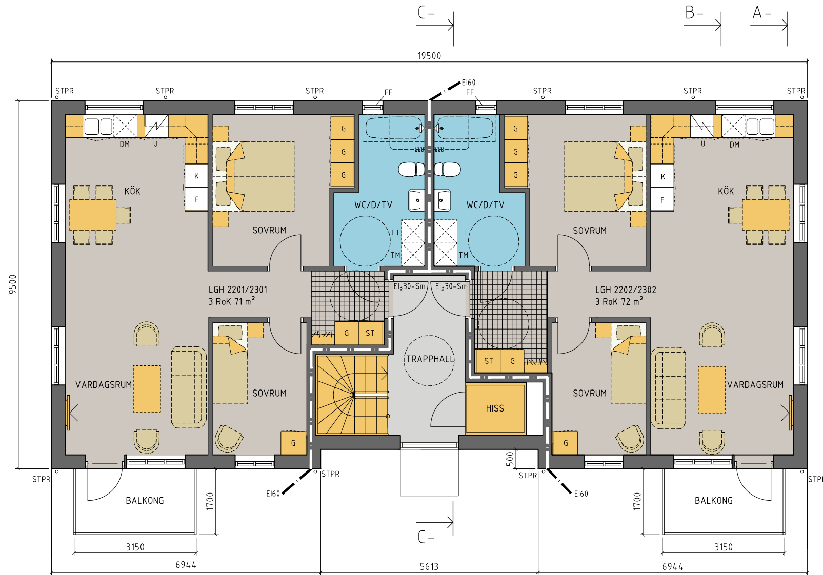
PLAN 1 TR OCH 2 TR 1:50/A1 1:100/A3